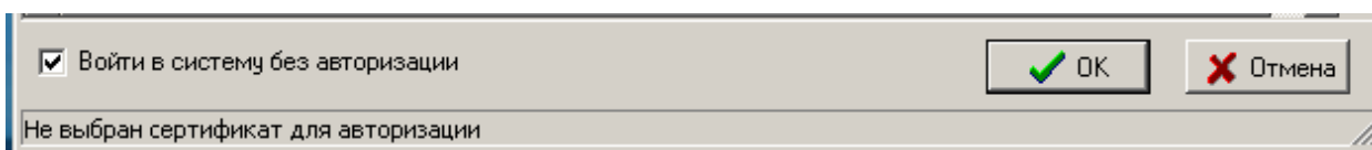
Рисунок 1- Авторизация пользователя

2) После этого поставьте «галочку» в поле «Войти в систему без авторизации» (см. Рис. 1) и нажмите «ОК»,